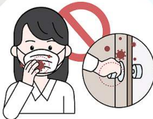
③ 마스크 겉면을 만지는 행위